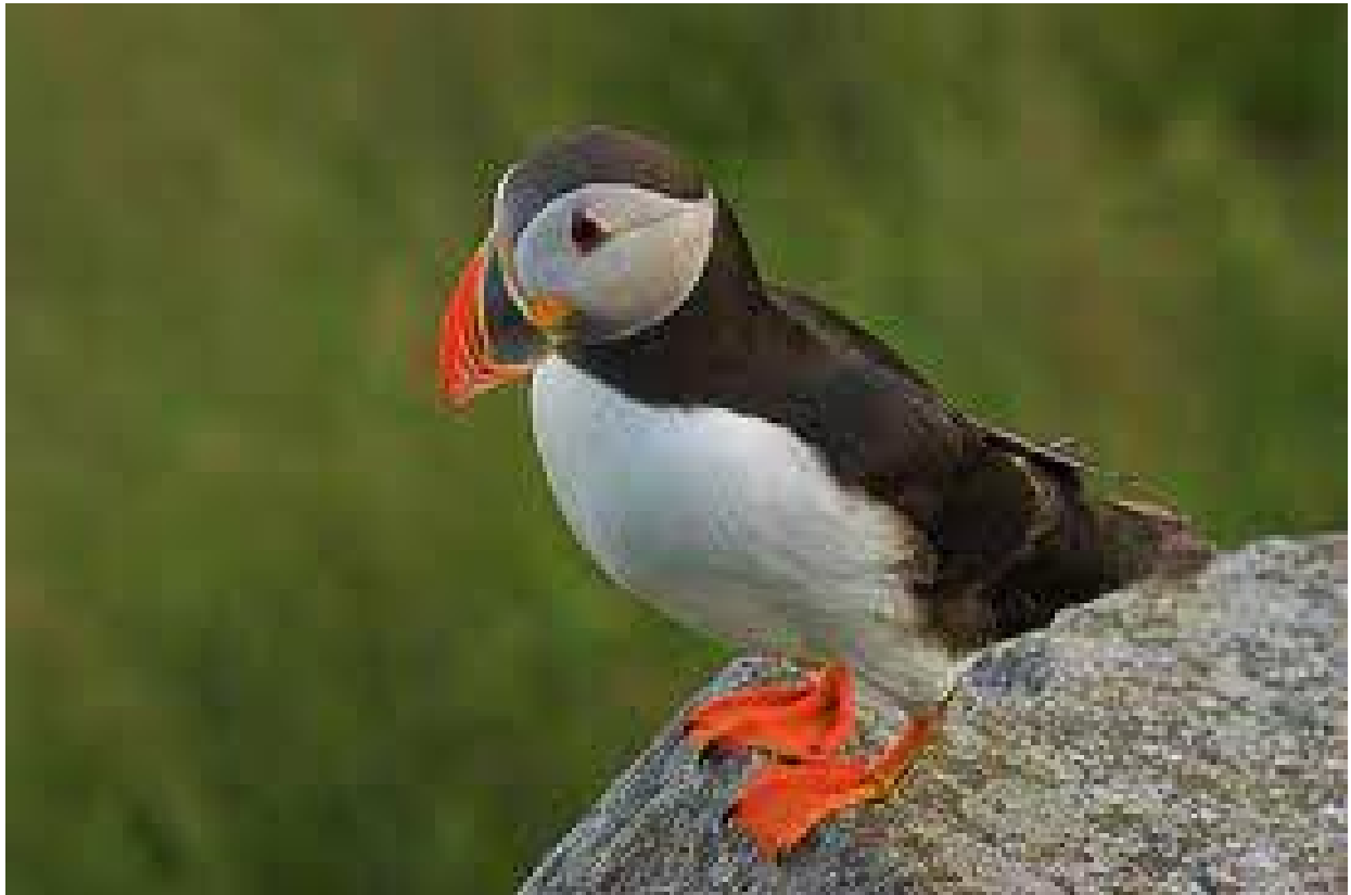
Vakantie op IJsland.